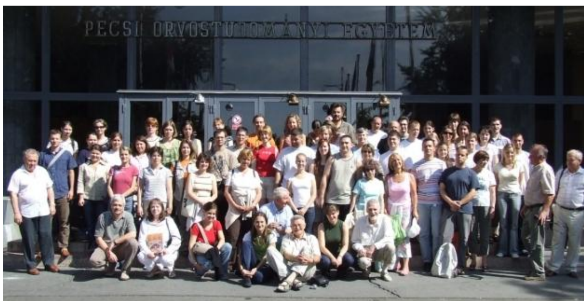
Csoportkép a Pécsi Tudományegyetem épülete előtt