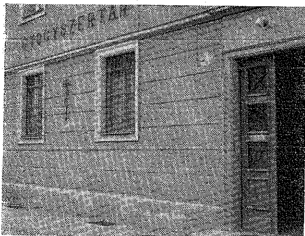
1. ábra. A veszprémi egyetemi városrész gyógyszertára

az ablakban elhelyezett zsalusán beállított üveg-rács, de ugyanakkor rajta keresztül a beszéd tisztán érthető. Az ablak akkora, hogy azon át az egész gyógyszertár berendezése és a bent folyó munka is látható. Az officinából nézve a kiadó ablaknak egyáltalán nincs „ablak” jellege, mert alatta egy táraasztal áll (2. ábra). Az officinában levő részén specialitások és más anyagok elhelyezésére szolgáló fiókokat találunk. Jobb és bal oldalon pedig, könnyen elérhető távolságra állnak a gyógyszerkülönlegességeket tároló szekrények úgy, hogy a gyógyszerésznek lehetőleg minden kézitány a közvetlen közelében lehessen. Ezt biztosítja az a megoldás, hogy az egyik részén mintegy másfél méterre van a kiadó ablak az officina oldalfalától, a másik oldalon pedig egy kiugró falrész teszi