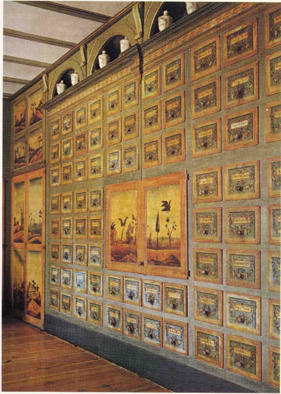
Magasfiókos szekrénysor Masnou, (Barcelona)