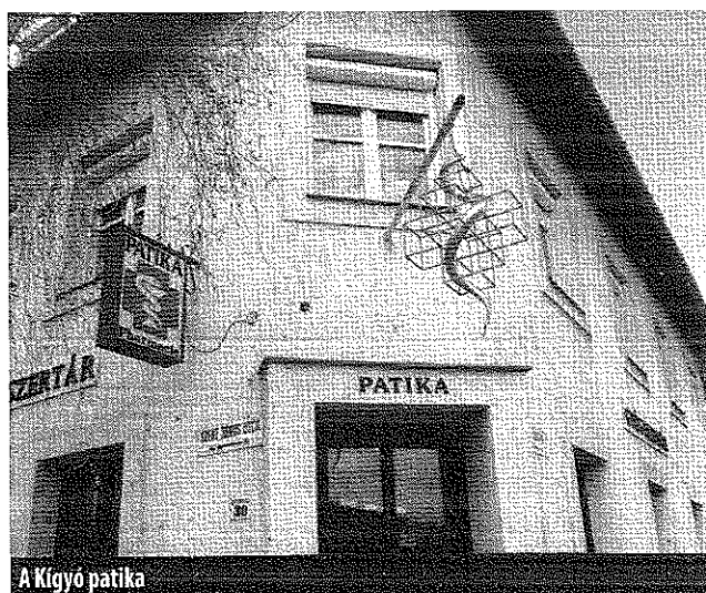
A Kígyó patika