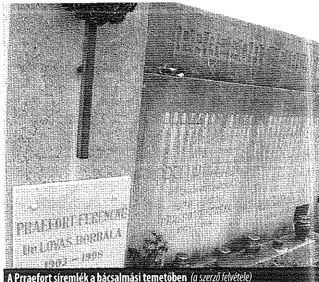
A Praefort síremlék a bácsalmási temetőben