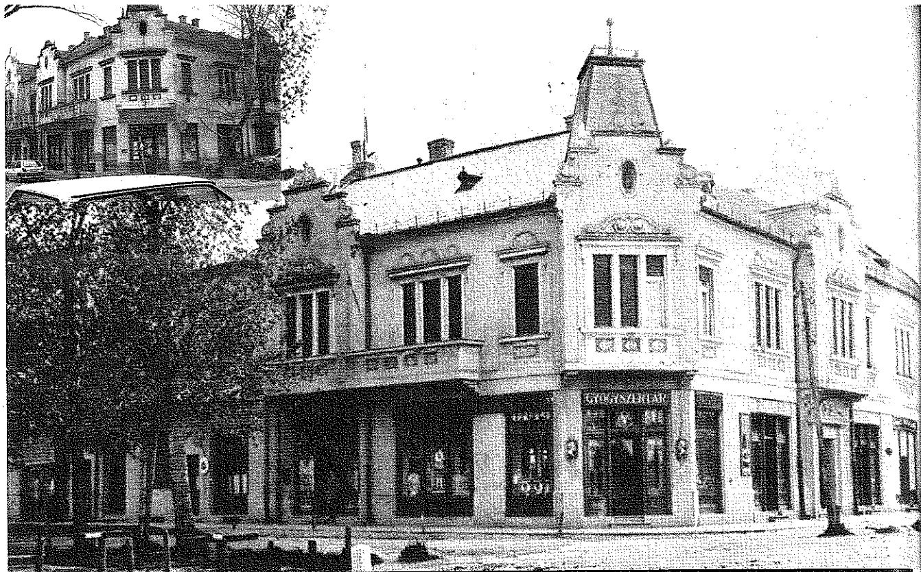
Az Ulrich-palota Bácsalmáson (képeslap Becherer Károly gyűjteményéből) a felső sarokban napjainkban, ma kék írisz a patika neve.

a Rónai féle azonban, mint állami gyógyszerészertár tovább működött.