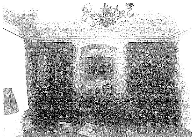
1. ábra A kaposvári Arany Oroszlán gyógyszertár inodája