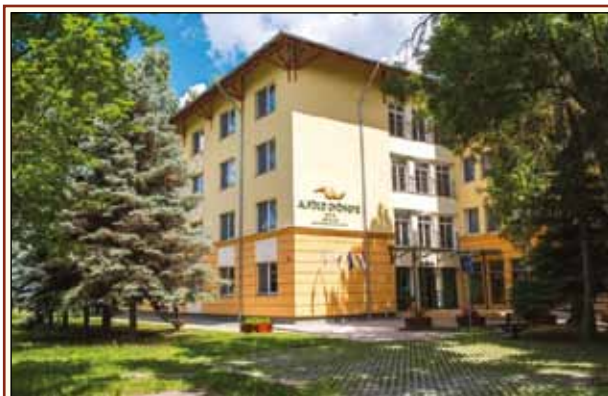
A jubileumi emlékverseny helyszíne

denki természetesen veszi azonban, hogy Békés megye kapja meg a kerek évfordulókat. 10 éve Gyulán került megrendezésre az emlékverseny. Az akkori szervezőbizottság elnökeként elmondhatom, hogy igen jól sikerült rendezvény volt úgy a tudomány, mint a társas programok terén is. Az itt elhangzó tudományos munkákat jó lenne felkarolni, s végigvinni a gyakorlati megvalósulásukig, hiszen e szellemi termékek legtöbbje a tára mellett készül, hivatásunkat jobbító szándékkal! Tíz évvel ezelőtt kitűztük, hogy szélesebb körben, a határon kívüli magyar kollégákat is jobban