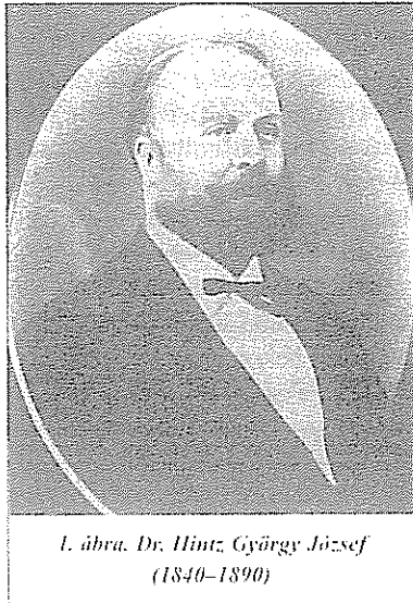
1. ábra. Dr. Hintz György József (1840–1890)

Gyógyszerészet-történetünk több hazai gyógyszerész-dinasztiával büszkélkedhet, amelyeknek tagjai időről időre meghatározó személyiségei voltak tudományos- illetve közéletünknek. Ezen dinasztiák közé sorolható a szász származású erdélyi Hintz család is, amelynek négy generációját követhetjük nyomon. Pályájuk fontosabb életrajti adatainak felidézése hasznos adalékokkal szolgálhat gyógyszerészet-történetünkhöz, egyrészt azért, mert 1863-1949 között a család tulajdonában volt az 1573-ban alapított kolozsvári „Szent György” patika, amely most gyógyszerésztörténeti múzeum, másrészt azért, mert a Hintz család tagjainak életútja hű tükröt adja az elmúlt másfél évszázad történéseinek.