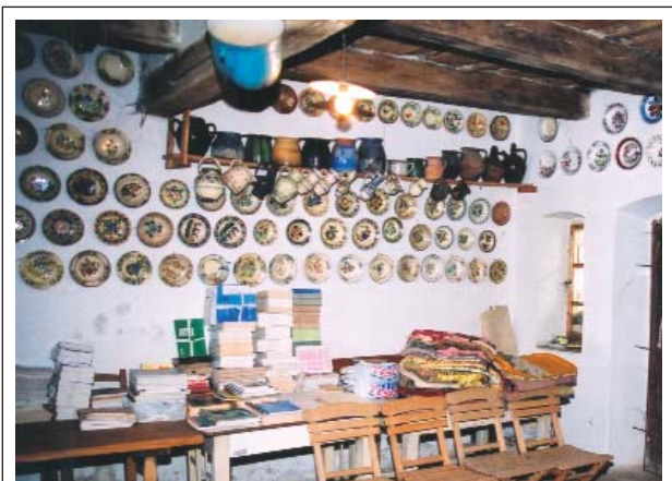
13. ábra: Az egykoron nagykonyha csupán tárgyaiban, népi cserepeiben, kerámiáiban őrzi az eredeti funkciót

ros baráti körben itt közölték egymással szűkebb és tágabb világuk valós történéseit, mondhattak véleményt nyíltan, nehéz idők visszaszólásáról.