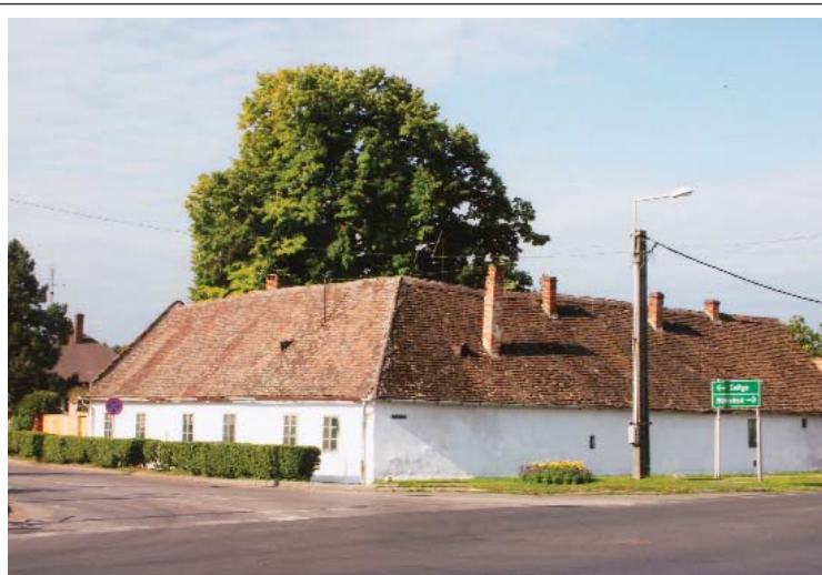
1. ábra: A „Brantner–Koncz Múemlékház” egykoron az Esterházy hercegi uradalom tisztartói laka. Ma agrártörténeti műemlék (épült a XVIII. sz. második felében).