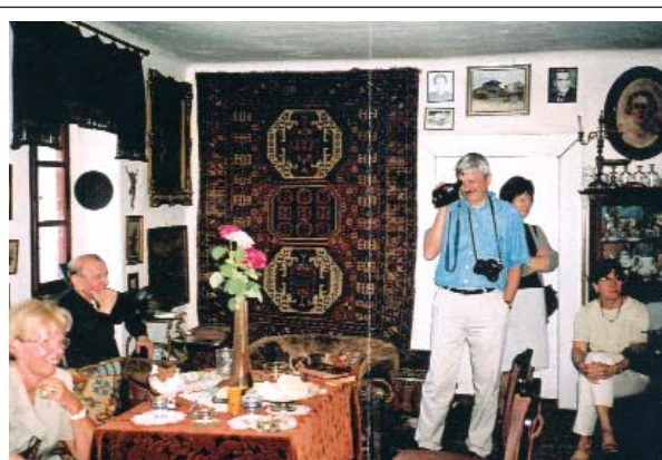
3. ábra: Vendégek a vendégszobában. A falon a XIX. századi kazah szőnyeg (műemléki védettség alatt).