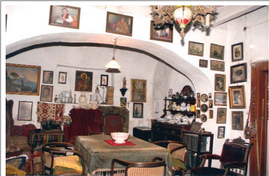
10. ábra: A lakás központja a boltíves kisebbédlő, a falat gazdag képanyag fedi