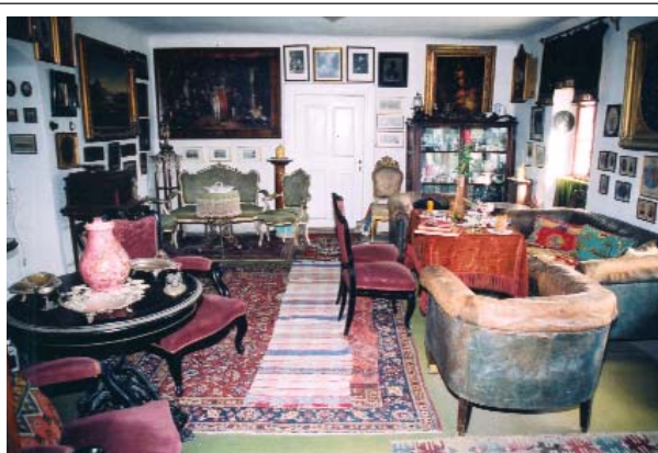
2. ábra: A fogadószoza. A falon családi képek, olajfestmények, rézkarcok. A sarokban neobarokk garnitúra.