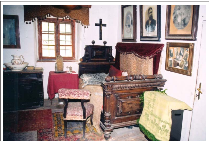
11. ábra: A „nagy mama szoba” német neoreneszánsz sötét bútoraival