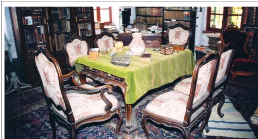
5. ábra: A könyvtárszoba, körben 14 tárolóban a családi hagyatéka és a vásárolt könyvek, középen a XVIII. századi diófa asztal.

anyagával. Mivel a múzeum magántulajdon, sem állami, sem önkormányzati támogatásban nem részesülhettem. Gál Károly egyetemi lelkész kezdeményezésére létesült a közhasznú „Szentlőrinci Brantner – Koncz Múemlékház múzeumi működését támogató alapítvány” [2]. A múzeum keretében elkülönül a gyógyszerészettörténeti gyűjtemény, benne gyógyszerész családom gyógyszerészeti anyagával, könyveivel, folyóirataival, dokumentumaival [3].