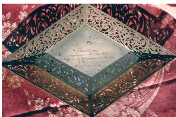
8. ábra: Konczné Brantner Majda Horthy Miklóstól kapott ezüst tiszteletdíja a pécsi teniszversenyen

A hálószoba festett, „úri magyaros” mintázatú bútorokkal, a falon függő Reitzer Elemér és Jenő festette magyaros mintázatú, műemlékileg védett 5 db fatáblájával, a ház lakóinak a magyar nép és a haza iránti elkötelezettségéről tanúskodik (9. ábra). A