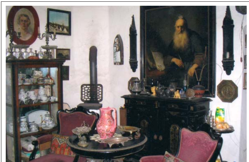
4. ábra: Szent Pál apostol. Rembrandt másolat (olaj) a falon, az asztalon Zsolnay kancsó a XIX. sz. végéről.