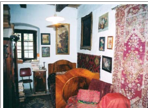
12. ábra: Az egykori gyerekszoba, biedermeier ágy és éjjeliszekevény, a falon XIX. századi kisázsiai szőnyeg