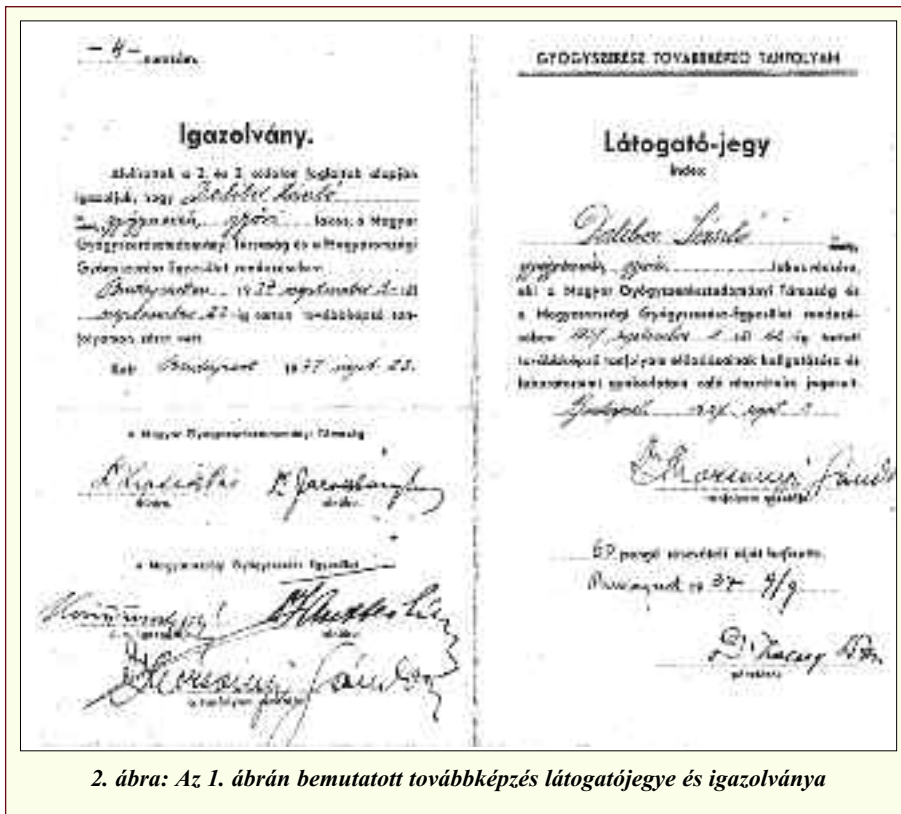
2. ábra: Az 1. ábrán bemutatott továbbképzés látogatójegyje és igazolványa