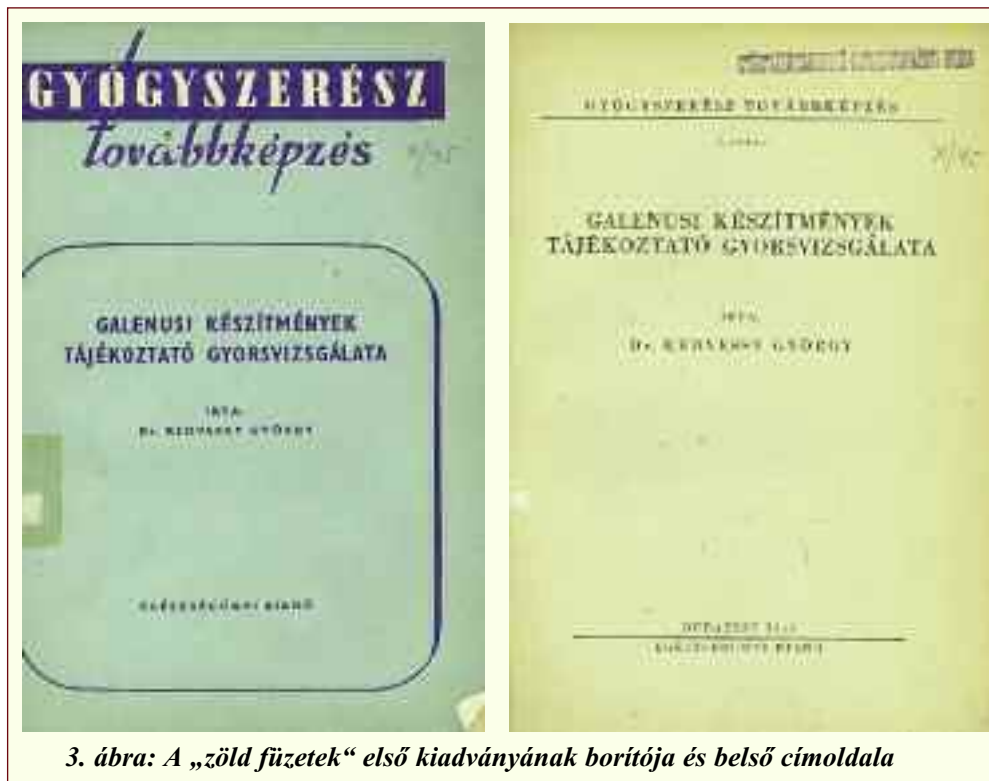
3. ábra: A „zöld füzetek” első kiadványának borítója és belső címoldala

tanból nagyon alaposan felkészítettek, akik ezt követően negyedévenként többnapos továbbképzésen vettek részt, ahol elsősorban az új gyógyszerekkel foglalkoztak, hogy így szerzett ismereteiket kollégáiknak és a human orvosoknak helyi továbbképzések keretében átadják. E hálózat gondozását – megalakulása, azaz – 1962 után az OGYI vette át (a hálózat közel-múltban történt megszűnését a magyar gyógyszerészet egyik veszteségeként könyveljük el).