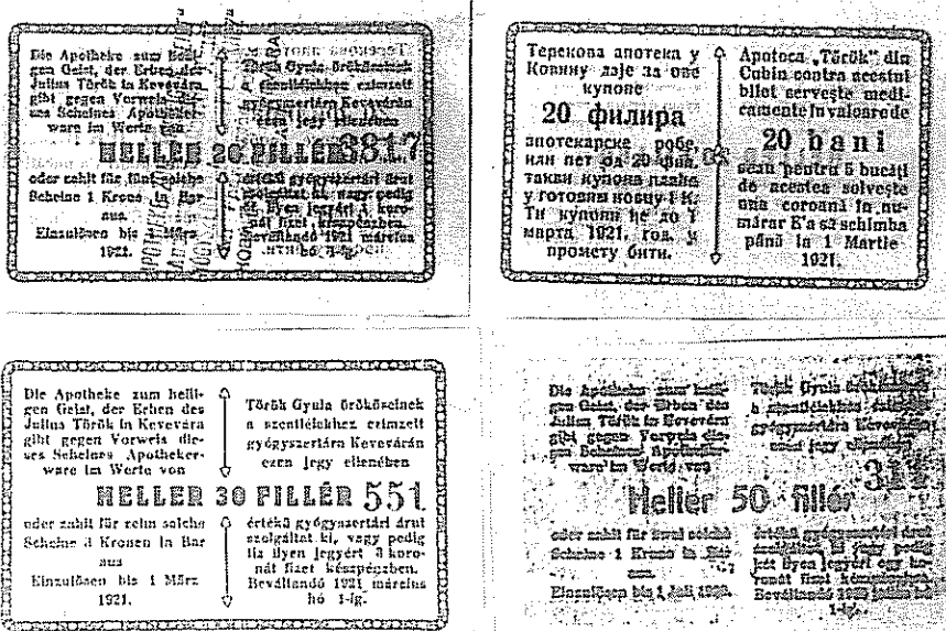
3. ábra. A kevevári gyógyszertár szükségpénzjeinek szövege a nemzetiségekre is tekintettel volt