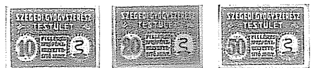
5. ábra. A Szegedi Gyógyszerész Testület egységes szükségpénzei