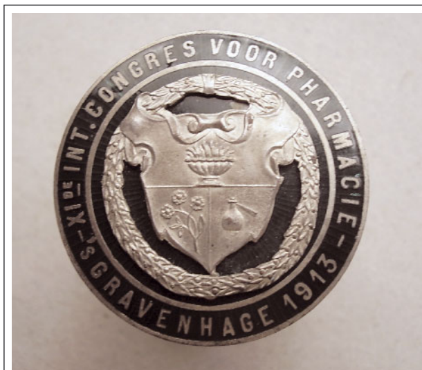
3. ábra: Az 1913-as nemzetközi kongresszus jelvénye