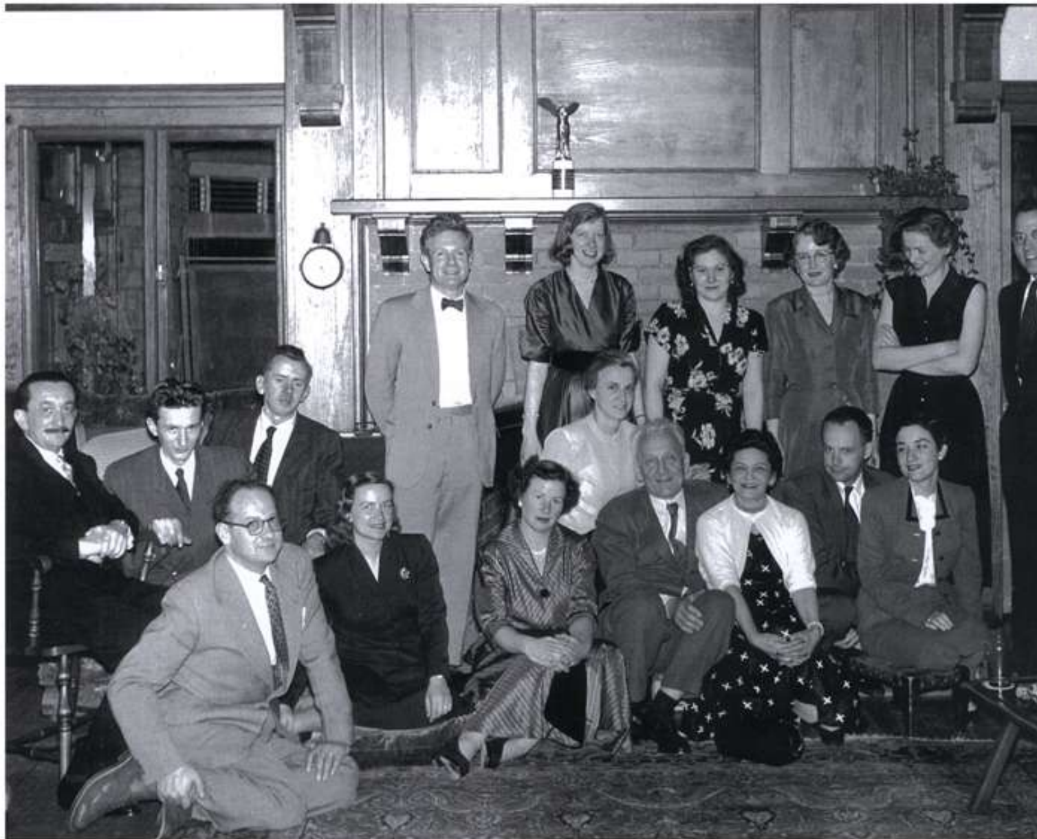
Fénykép 1954-ből (Ráth és Szent-Györgyi mások társaságában amikor Szent-Györgyi elnyerte a Laskar-díjat (Seven Winds, USA)