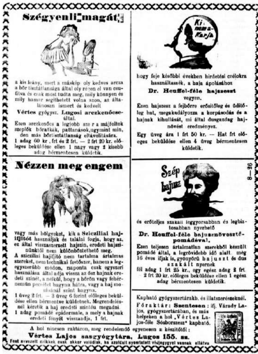
Vértés Lajos egy hirdetése a Szentesi Lap egyik 1895-ös számában (a Szerkesztő kiegészítése)