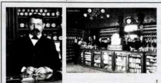
Palatul Verdes (1896) și farmacia