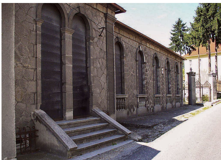
A kékkői ház mai állapotában (Dom nad potokom címen található jelenleg)

Pár éve jártam a néhai falucskában és az épület szépen felújítva, de kiváló állapotban áll az azóta várossá nyilvánított helységben, sajnos jelenleg lakatlanul. A neve Dom nad potokom (Ház a patak felett) így hirdette pár éve egy ingatlanos szlovák cég, és ez van a házon egy táblán is. A híres ú.n. Balassi váron kívül ez a legszebb épület a helységben és ez nem elfogultság!