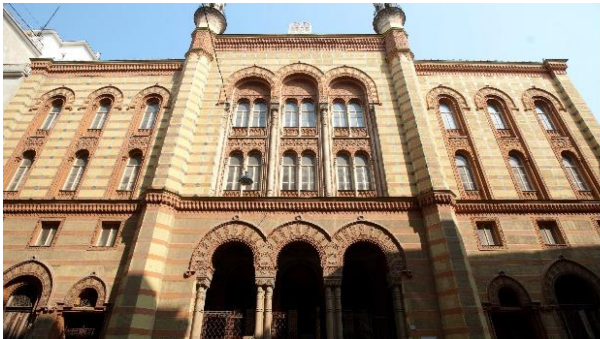
Rumbach Sebastyén utcai zsinagóga