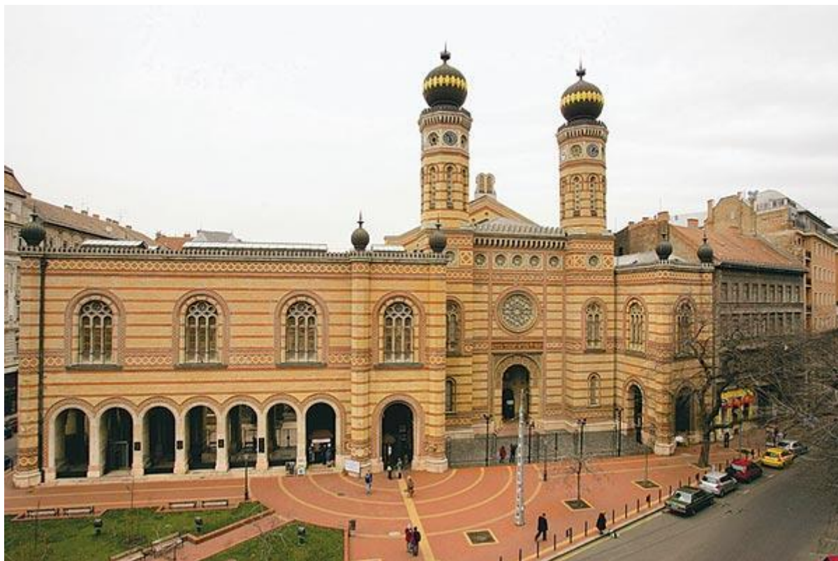
Dohány utcai zsinagóga