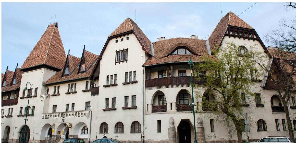
A Wekerle-telep egyik lakóháza

1911-1914 között négy iskola, két óvoda létesült. Az állami telep létesítésének első éveiben állami alkalmazottak és tisztviselők költöztek ide. 2011 szeptemberében műemléki jelentőségűvé vált (5).