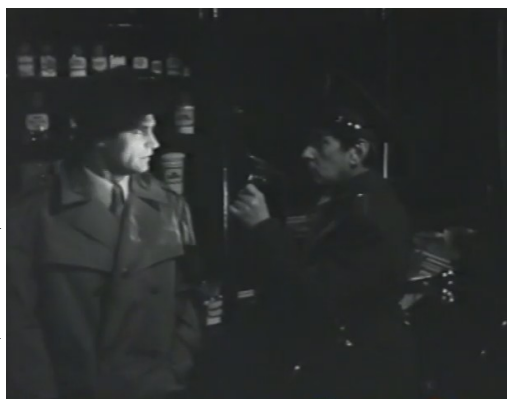
8. Ábra: A patikai jelenet a Hekus lettem című filmből