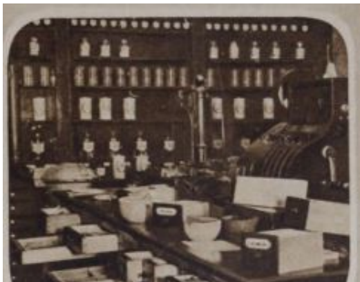
1. Ábra: A gyógyszerertár a betörés után