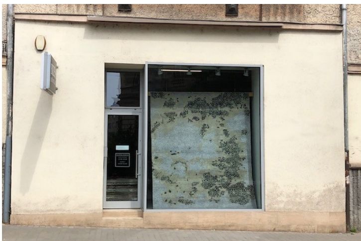
7. Ábra: A gyógyszertár eredeti helyszíne napjainkban