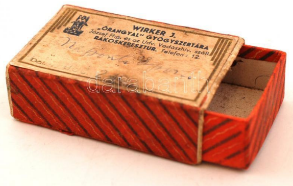
3. ábra: Emlékek a rákoskeresztúri Wirker Vadászpaticából (Órangyal gyógyszertár)

Persze Wirker nem csak róka gránátot készített és forgalmazott, hanem sok minden mást is. Megtalálhatóak voltak a kínálatában az állatgyógyászati készítmények, nyalósók, fegyver- és bőrolajok, rácsálóirtásra szolgáló készítmények, szárnyas dúvadirtásra kifejlesztett foszforszörp és vadkár elleni riasztó szerek is. A Vadászpatika termékei országszerte ismertek és keresettek voltak.