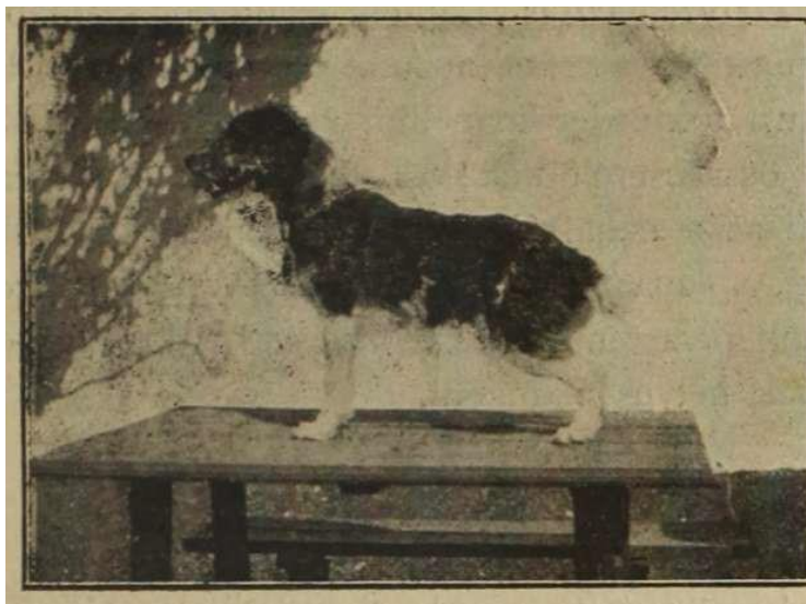
5. ábra: Cigánybáró Rákos (Vadászat és Állatvilág, 1907)