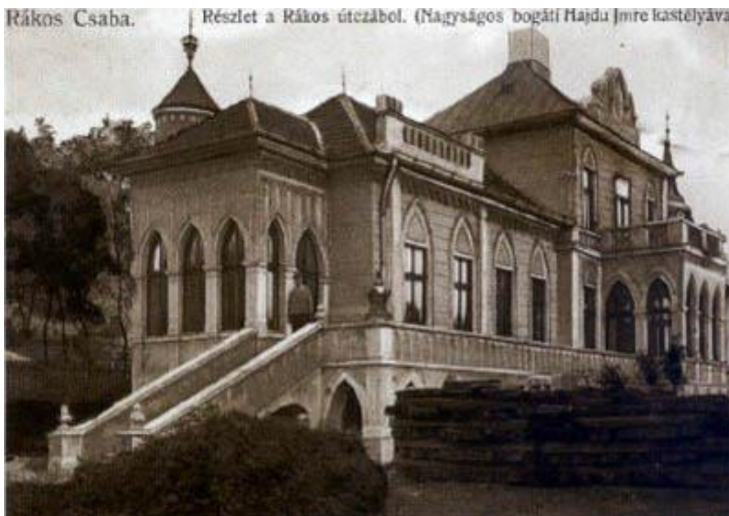
1. ábra: a Bogáti-Hajdú Villa, amit Süllyedő kastélyként is hívnak

Persze nyilván errefelé is vadásztak, erről tanúskodik például a kerületben, Rákoscsabán álló egykori vadászvilla, a Bogáti-Hajdú Villa, amit Süllyedő kastélyként is hívnak, ezt Bogáti-Hajdú Imre táblabíró építtette fel az 1800-as évek végén.