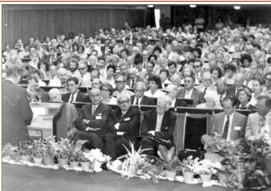
FIP Kongresszus Budapesten