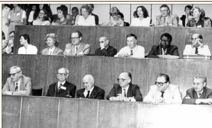
FIP Kongresszus Budapesten

Peter Speiser professzor a FIP tudományos kollégiumának elnöke a következőképpen szolt: „...az egészségügyi ellátás keretében a gyógyszerellátásnak egyre növekvő szerepe van világszerte. Ugyanakkor sajnos beszélni kell a gyógyszerellátás árnyoldalairól is, mivel számos szakképzetlen, a gyógyszerekkel kapcsolatban semmilyen, vagy csak felszínes ismeretekkel rendelkező személy foglalkozik gyógyszerekkel, vesz részt a gyógyszerellátásban. Ezért növekszik a veszélye annak, hogy egy általános tudás a