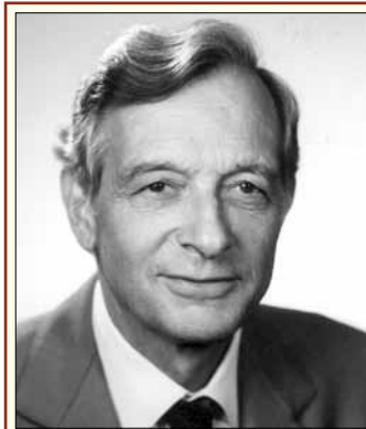
André Bédát FIP-elnök

végül, de nem utolsósorban, felkészül arra, hogy a betegnek és az orvosnak kellő információt nyújtson. Következésképpen a gyógyszerész széles körben juttatja el az egészségügyi ellátás anyagát.”