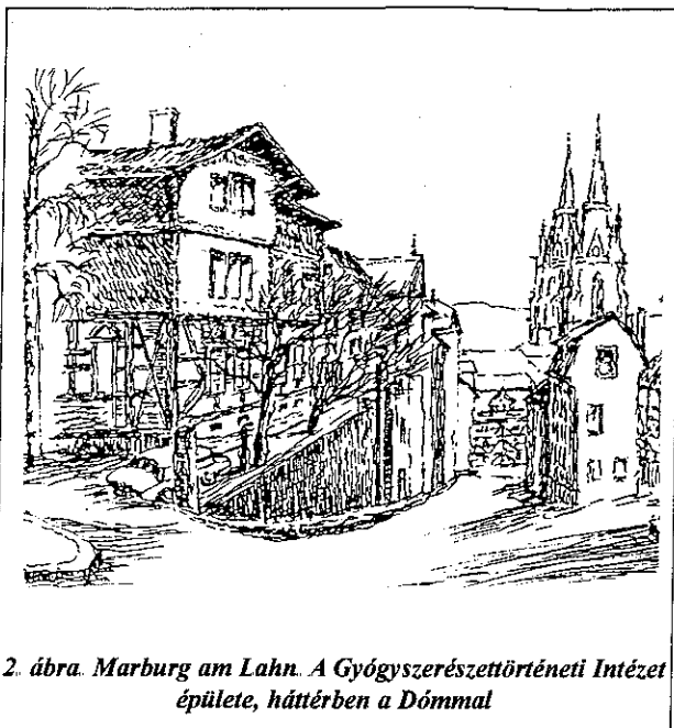
2. ábra. Marburg am Lahn. A Gyógyszerésztörténeti Intézet épülete, háttérben a Dómmal

A tudományos ülést követően az esti órákban az Intézet igazgatója, Krafft professzor és munkatársai fogadást adtak a vendégeknek, amit másnap az Intézet helyszíni