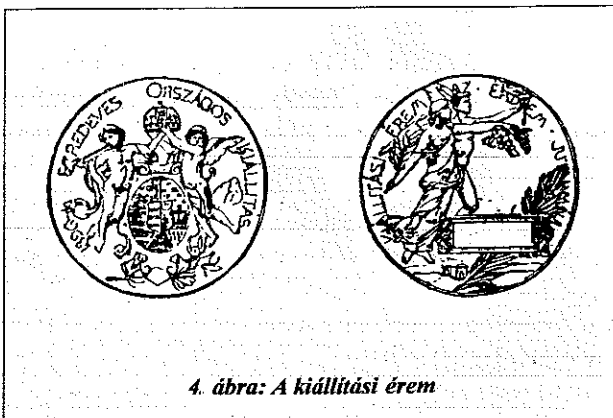
4. ábra: A kiállítási érem

A kiállítók mind valamilyen jutalomban részesültek.