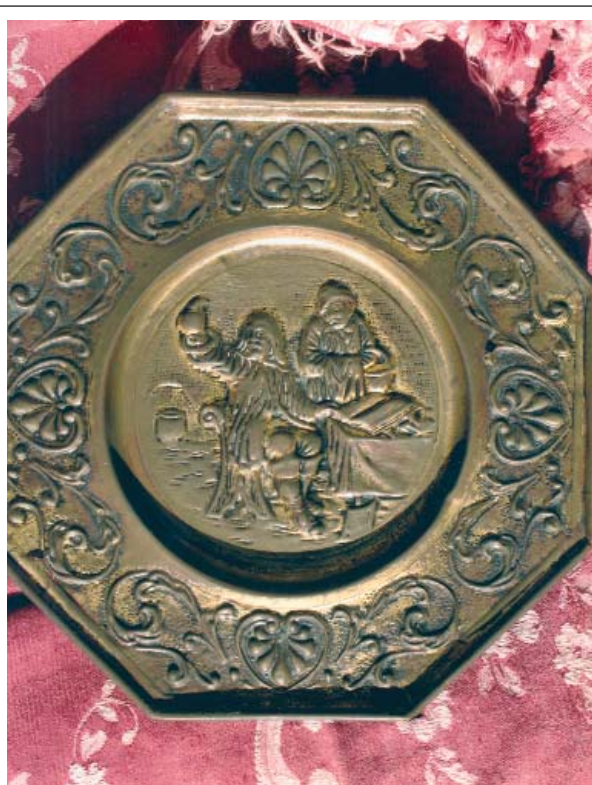
4. ábra: Relief, gyógyszerész munka közben, nöbeteg társaságában