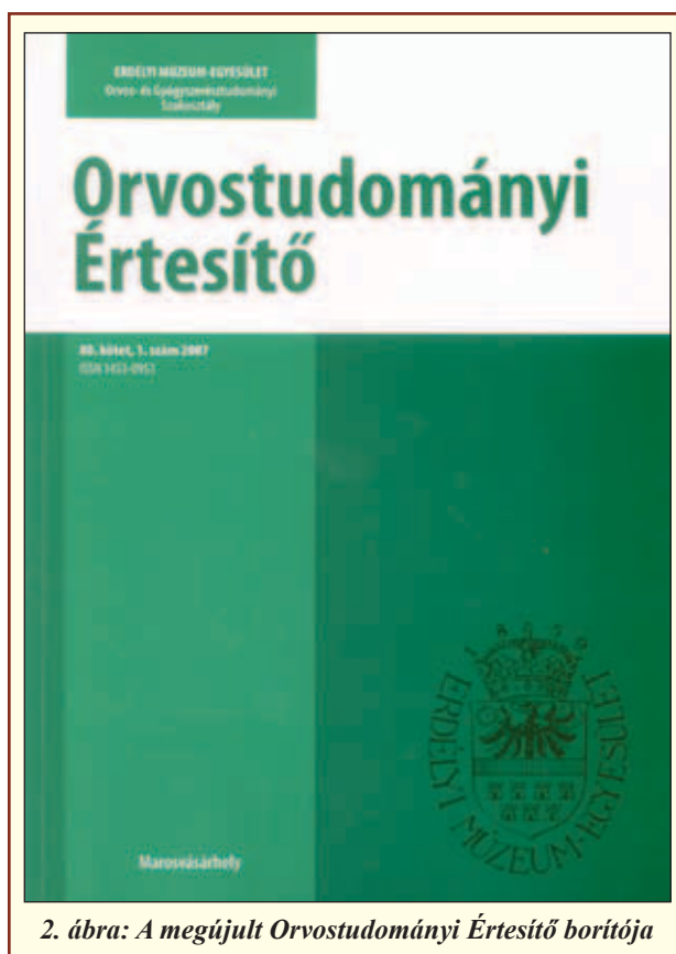
2. ábra: A megújult Orvostudományi Értesítő borítója

Az Orvostudományi Értesítőben való közléseket követve megállapítható, hogy az eltelt 20 évben a kötetekben állandó a gyógyszerészek jelenléte. Az összes közlemények száma azonban 2010-ben már szinte a felére esett vissza a 10 év előttihez képest. Ennek sajnálatos magyarázata a szakterületeken is erőteljesen megnyilvánuló globalizáció, az angol nyelvű közlés (ISI) egyeduralmával. Ismeretes, hogy az ún. „hatásmutató” ( impact factor ) az egyik legfontosabb tényező az egyetemi, tudományos előmenetelben, és ez az angol nyelvű folyóiratokban megjelent közlemények idézettségén alapszik [4]. E kényszerítő körülmény magyarázza, hogy a gyógyszerészek közlési forrásai közül jelenleg például a német Die Pharmazie , továbbá a román Farmacia, Revista de Chimie , és Acta Medica Marisiensis (MOGYE) is kizárólag angol nyelvű cikkeket közöl. Mindez jelentős válaszut elé állítja az EME OGYSZ folyóiratát, olyan helyzetben, amikor a magyar nyelvű gyógyszerészképzés törvényes alapon való kiszélesítése a cél.