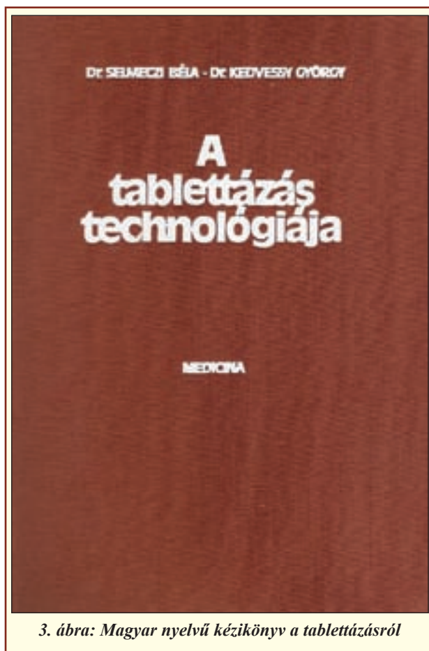
3. ábra: Magyar nyelvű kézikönyv a tablettázásról