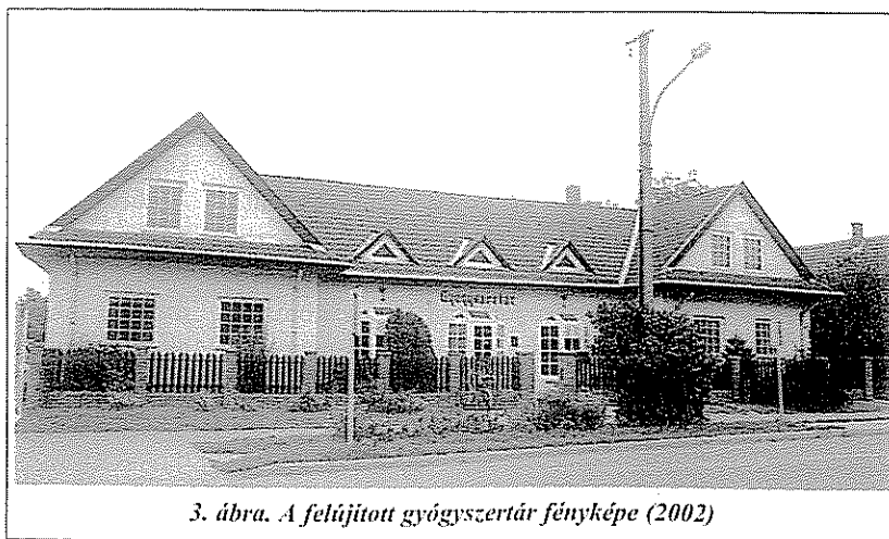
3. ábra. A felújított gyógyszerertár fényképe (2002)