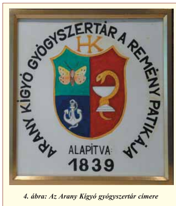
4. ábra: Az Arany Kígyó gyógyszertár címere

Dabason, a „szűkebb körben, amelyben működött” emlékét őrizzük és ápoljuk, szellemi örökségét pedig büszkén vállaljuk. Az „Arany Kígyó” gyógyszertár – a „Reményhez” gyógyszertár jogutódjaként – címeiben elhelyezte a medvelepkét, a következő jelmonddal: „Arany Kígyó gyógyszertár a remény patikája” (4. ábra).