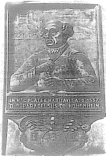
2. ábra: Paracelsus emléktábla Pozsonyban