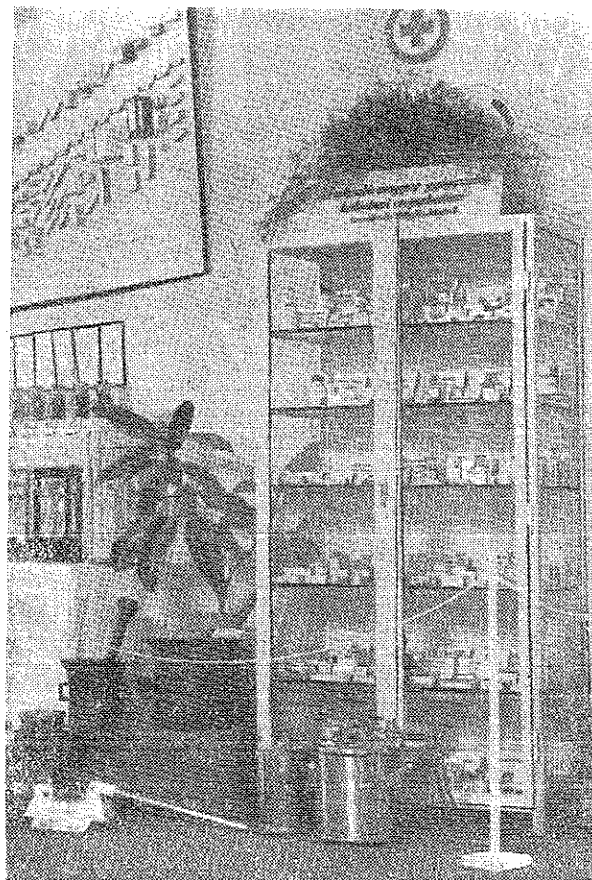
3. ábra. Gyógyszerészeti eszközök és a magyar gyógyszeripar termékeinek szekrénye

Ma Szombathelyen működik az ország nagyságban második, és egyben egyik legjobban felszerelt kórháza,