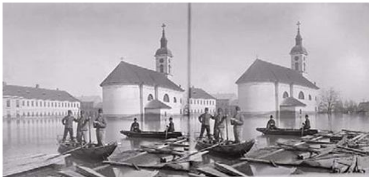
Szegedi árvíz (sztereo fotó)