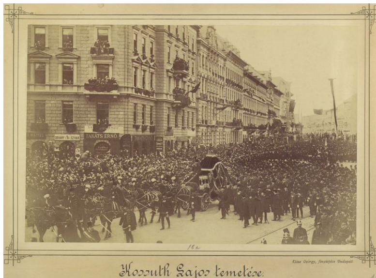
Kossuth koporsóját kísérő tömeg a Nagykörúton, 1894. március 30.