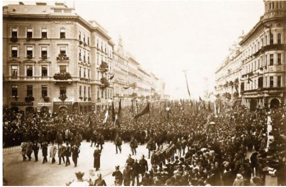
Kossuth Lajos temetése