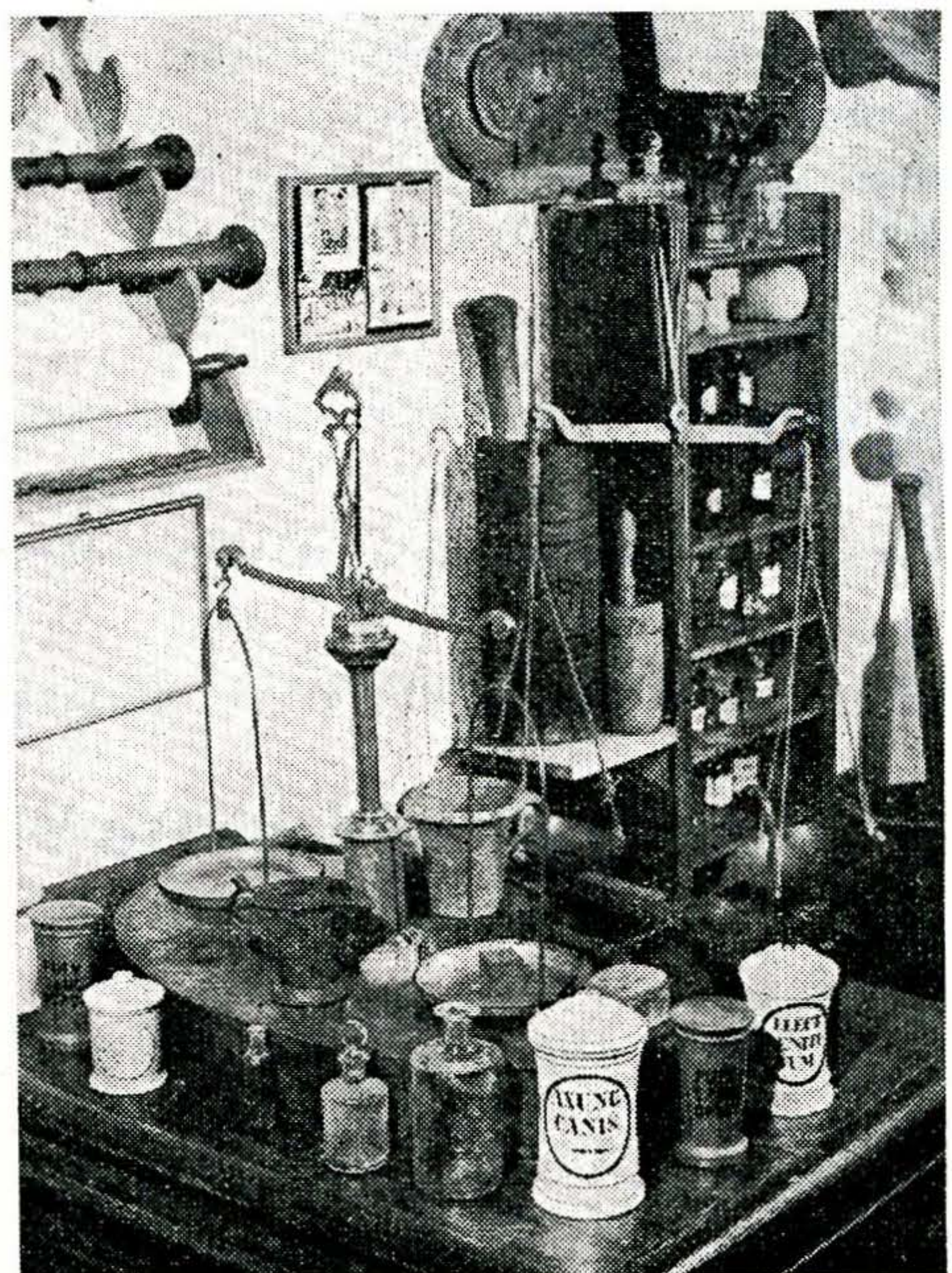
4. ábra. Sarokrészlet a régiséggyűjteményből