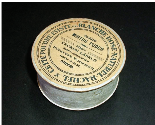
4. kép: A Mirtus púder doboza