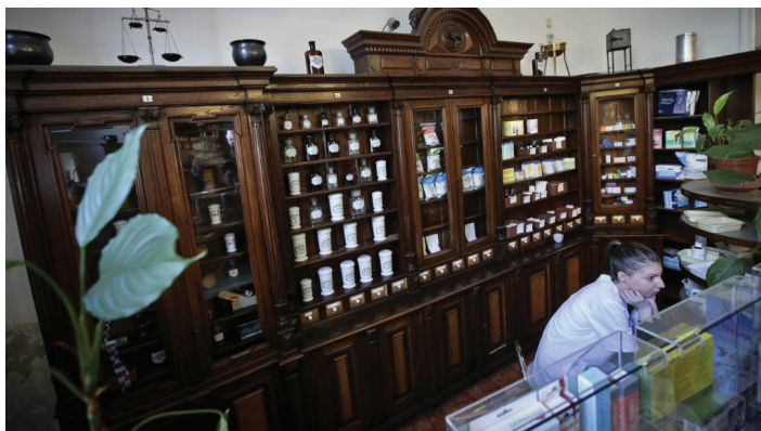
8. kép: Az Apostol gyógyszerészár egykori, védetté nyilvánított bútorzata