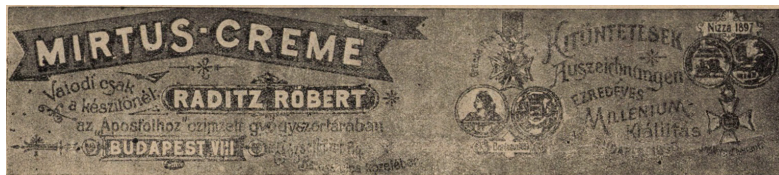
2. kép: A „Mirtus-Creme” védjegy bejegyzése 1898-ból