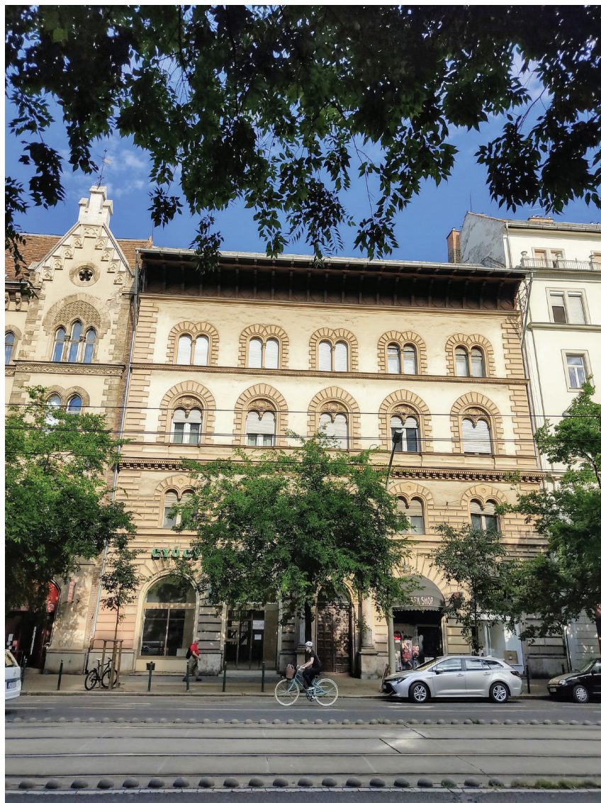
1. kép: Budapest, József krt. 64. a 2021-ben bezárt gyógyszerár portáljával