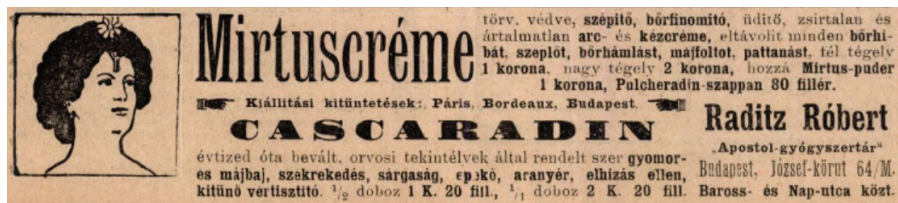
3. kép „Mirtus-Creme” reklám 1902-ből