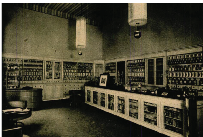
7. kép: Az Apostol patika az 1930. évi modernizálást követően